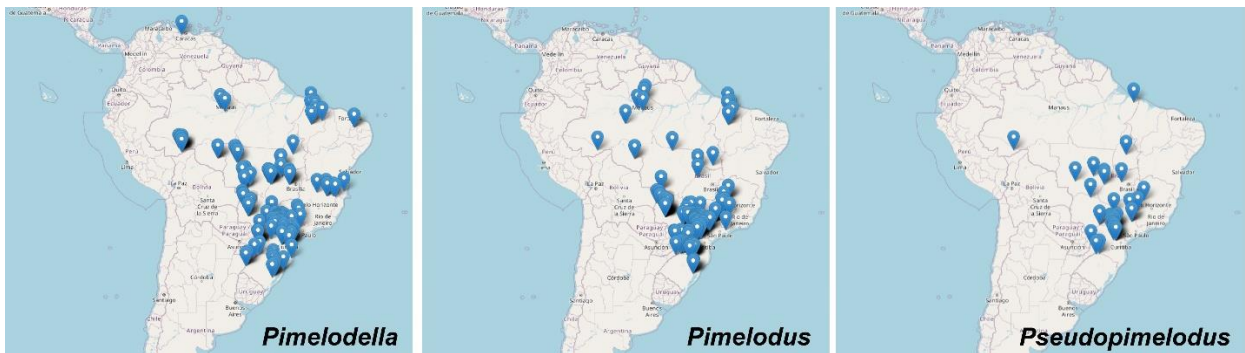
Figura 3. Mapas de distribuição geográfica dos lotes dos gêneros numericamente mais representativos da coleção do MZUEL.