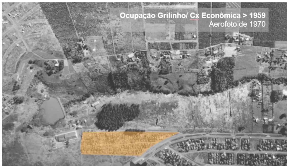
Figura 2 – Localização da Favela da Caixa Econômica – aerofoto de 1970, atual Conjunto Habitacional Paranoá II ou Jardim Nossa Senhora da Paz.