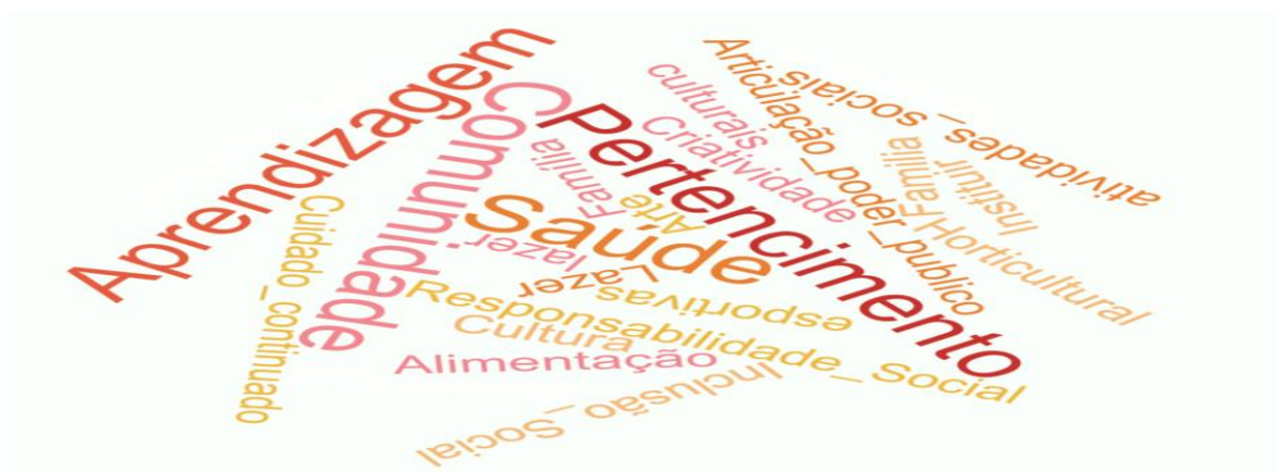
Fig. 1. Word Cloud – Evocações quanto aos objetivos dos projetos pesquisados.

Para a realização do presente artigo, foram buscados nestas IS projetos de intervenção em desenvolvimento, para averiguar e refletir sobre sua relação com os Direitos Humanos. Assim, quatro instituições aceitaram participar desta pesquisa sob critério de anonimato, sendo três instituições socioassistenciais não governamentais e uma instituição da rede governamental. Assim, dos projetos observados, destacam-se: 2 projetos destinados ao Desenvolvimento e na Defesa de Direitos da Pessoa Com Deficiência, com ações que envolvem tanto a assistência social quanto a educação; 1 destinado à pessoa idosa, com ações que buscam promover os direitos da pessoa idosa, sua saúde, segurança e participação, valorizando os vínculos familiares e intergeracionais, por meio de acompanhamento domiciliar, fortalecendo a Rede de Solidariedade; 1 programa da rede Governamental: Programa de Habitação, com ações desenvolvidas para a regulamentação e estabelecimento de regras de participação da comunidade da região no Projeto de Hortas Comunitárias; E 1 projeto responsável pelo atendimento e assistência ao Portador do Vírus HIV através do Serviço de Convivência e Fortalecimento de Vínculos, com ações que se desenvolvem por atividades de diversas modalidades, como dança, com crianças e adolescentes em situação de risco ou vulnerabilidade social. Desta forma, destaca-se que dentre os objetivos dos projetos monitoramento, coordenação e execução das seguintes evocações: