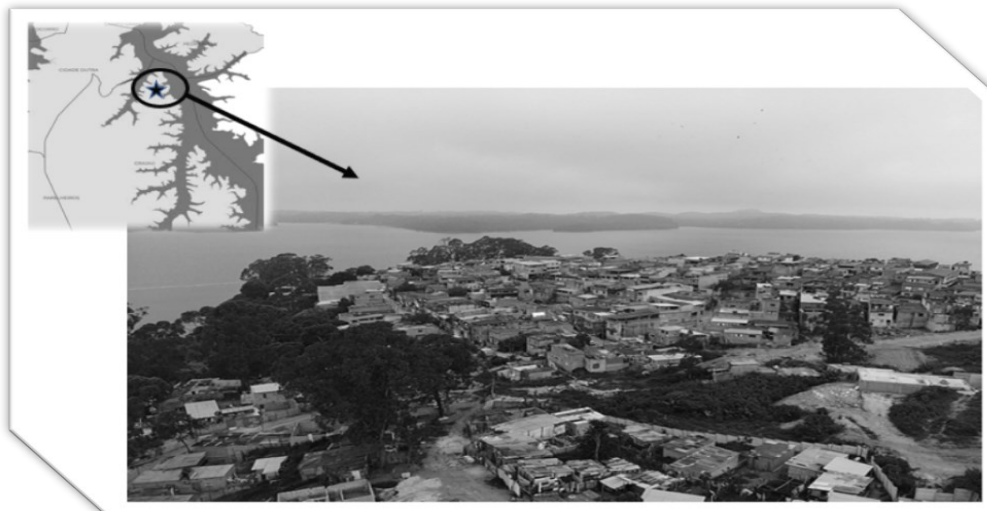
Figura 1 – Localização da Ocupação Gaivotas, no distrito do Grajaú, SP