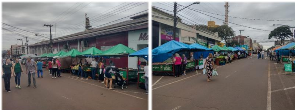
Figura 3 – início da movimentação da Feira do centro