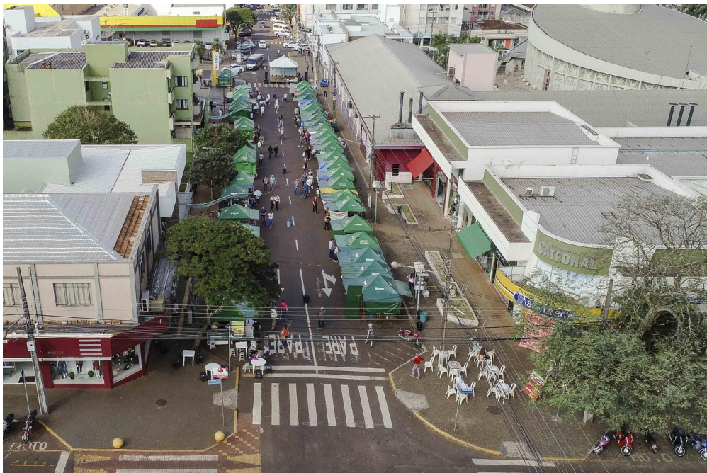
Figura 2 – Feira do centro