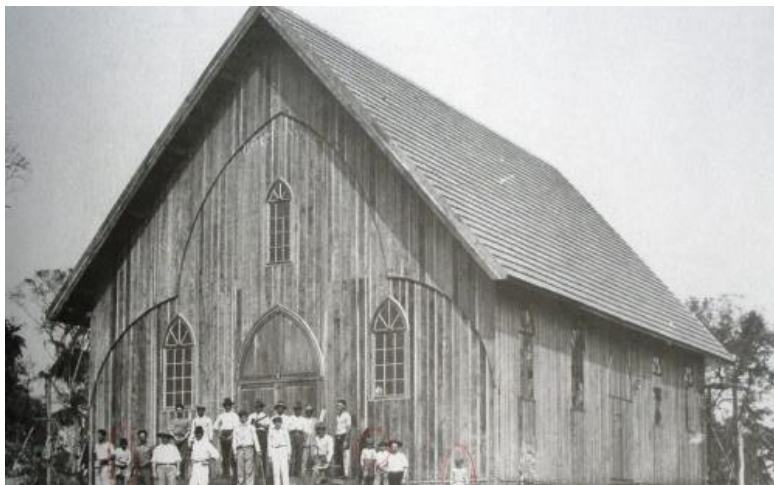
Figura 1 - Igreja Matriz de Londrina em 1934