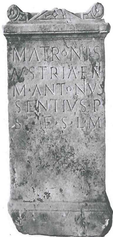
Morken-Harff (S. 50 ff.) Nr. 2.

vação sob os efeitos do depósito de lama, ao passo que as pedras calcárias manifestaram uma superfície enferrujada e descolorada devido aos efeitos do intemperismo. Abaixo segue a imagem de um dos altares intactos e sua reconstrução gráfica: