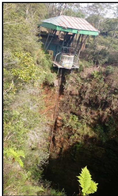
Figura 8- Elevador de acesso a Furna 1, no Parque Estadual de Vila Velha. O elevador encontra-se desativado.

Na figura 9 é possível observar com maior nível de detalhe a beleza cênica proporcionada pela Lagoa Dourada.