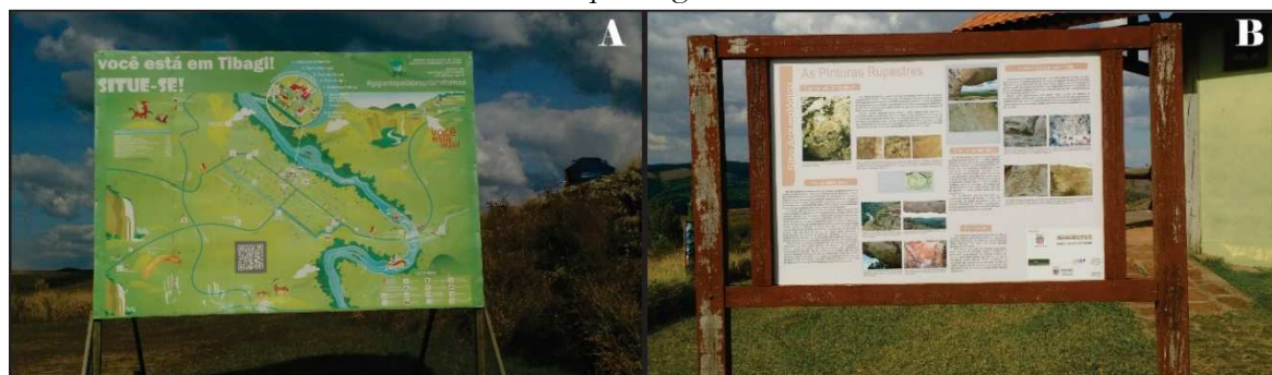
Figura 2- Entrada do Parque Estadual do Guartelá. A- Placa de Localização do parque dentro do município de Tibagi; e B- Painel de divulgação da geodiversidade evidenciando a existência de um sítio arqueológico.

Considerando as espécies vegetais, observou-se a existência de arborização ombrófila mista e densa em fundo de vale, vegetação característica de floresta considerando a localização do parque na região dos Campos Gerais. A vegetação de pequeno porte predomina no parque com resquício de cerrado. Conforme levantamento e informações auferidas no centro de atendimento do parque são quase 800 espécies vegetais catalogadas, tendo em vista as diversas condições de relevo e solo, fator que comprova a influência da geodiversidade na existência de biodiversidade.