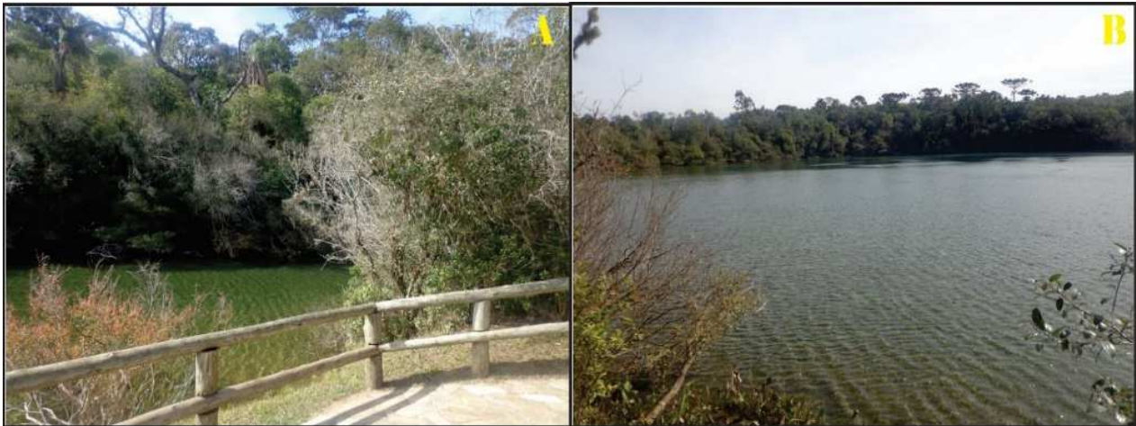
Figura 9- Lagoa Dourada, no Parque Estadual de Vila Velha. A- Limite em madeira onde é permitida a chegada dos turistas; e B- Vista da Lagoa Dourada, demonstrando sua beleza e atratividade turística.