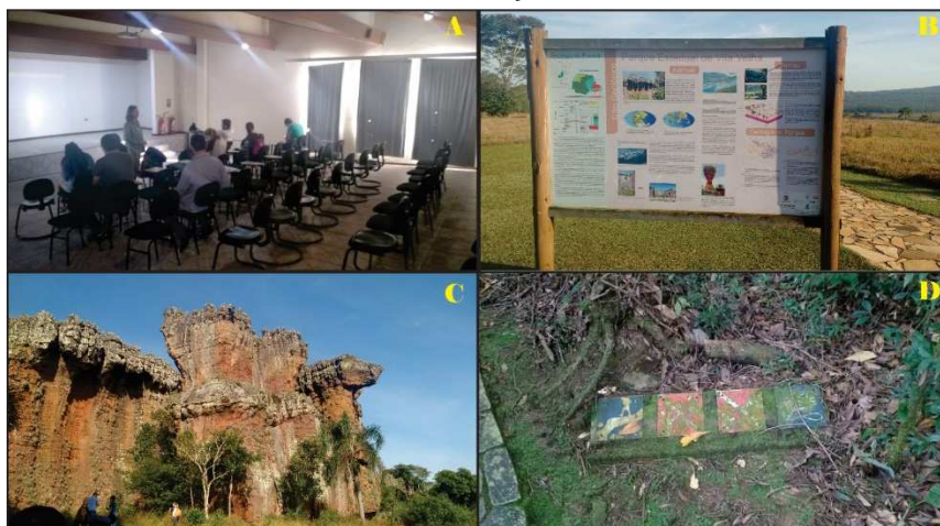
Figura 5- Parque Estadual de Vila Velha. A- Sala de vídeo no centro de recepção de visitantes do parque; B- Paineis de divulgação no início da trilha do parque; C- Exemplo das formações do relevo ruiforme existente no parque; e D- Placas de aviso aos turistas encoberta por lodo, precisando de manutenção.

O Parque contempla capacidade de carga para receber até 800 visitantes. As visitas são as segundas, quartas e quintas para grupos com hora marcada. Nas sextas, sábados e domingos à visitação é feita por um maior número de visitantes, podendo ser realizada pela população em geral. A frequência média é que em dias de maior fluxo, a cada 45 minutos um ônibus com 40 pessoas chegue ao parque com turistas para visitação. O parque possui 4 ônibus e destes, 3 estão sendo utilizados já que um dos ônibus se encontra em manutenção. Além dos turistas em geral, o parque recebe estudantes de ensino fundamental e médio, principalmente de Ponta Grossa e Curitiba, todas as informações descritas foram obtidas no início da visitação ao parque.