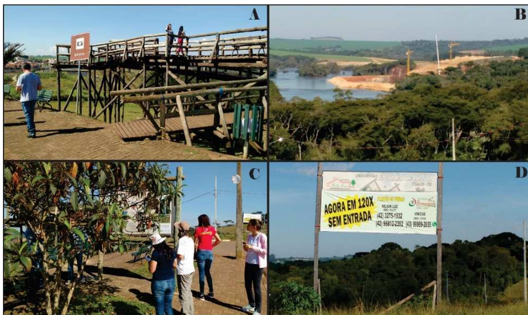
Figura 8- Principais feições observadas na parada feita no mirante de Tibagi. A- Estrutura física do mirante; B- Construção da PCH; C- Face do painel de divulgação com visão prejudicada pela existência de uma árvore; e D- Placa de loteamento residencial.

Constatou-se ao lado do mirante uma área de loteamento residencial, que pode ser evidenciada pela existência de uma placa de propaganda da loteadora e disposição de quadras e postes para transmissão de energia elétrica e instalação de iluminação pública já concretizada, evidenciando-se pouca importância dada a conservação. Os principais pontos descritos até aqui podem ser observados com maior detalhamento na figura 1.