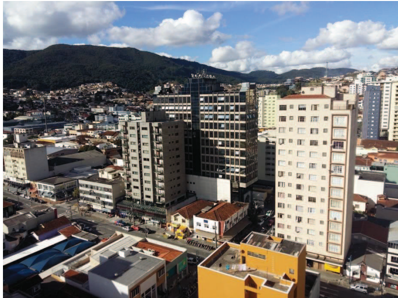
Figura 6 - Pontos observados no trabalho de campo