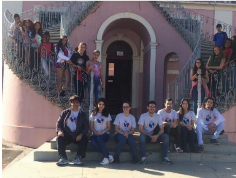
Figura 5 - Pontos observados no trabalho de campo