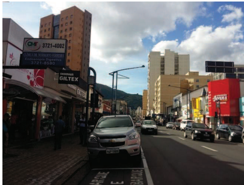
Figura 3 - Pontos observados no trabalho de campo