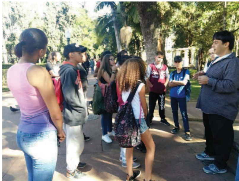
Figura 4 - Pontos observados no trabalho de campo