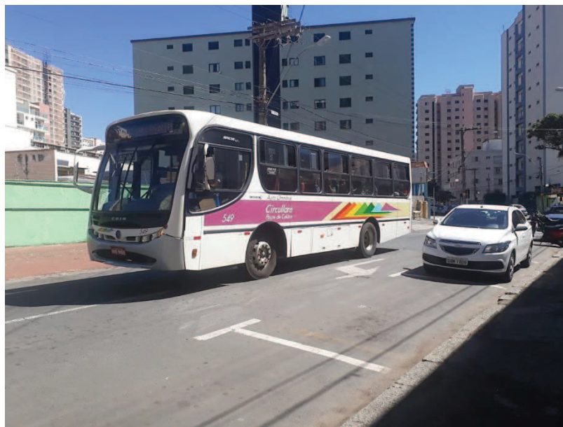
Figura 2 - Pontos observados no trabalho de campo