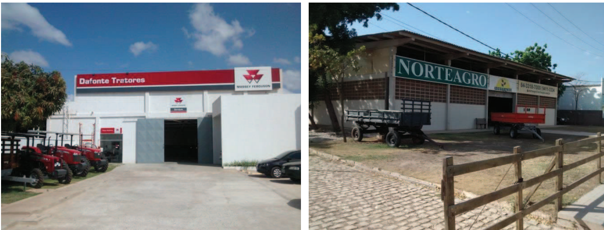
Figuras 1 e 2: Mossoró – Empresas comerciais de insumos e equipamentos agrícolas (2015).