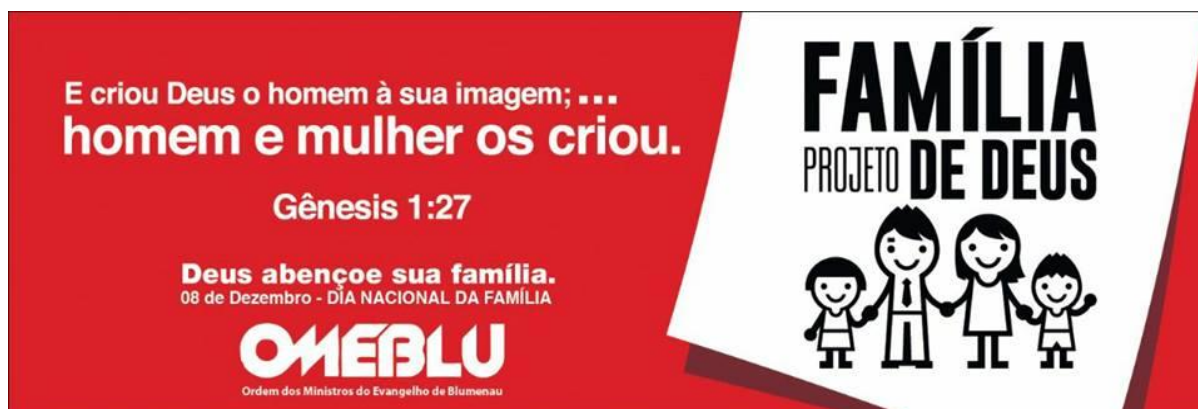
Figura 2 - Capa utilizada pela página oficial da OMEBLU na rede social facebook em dezembro de 2017