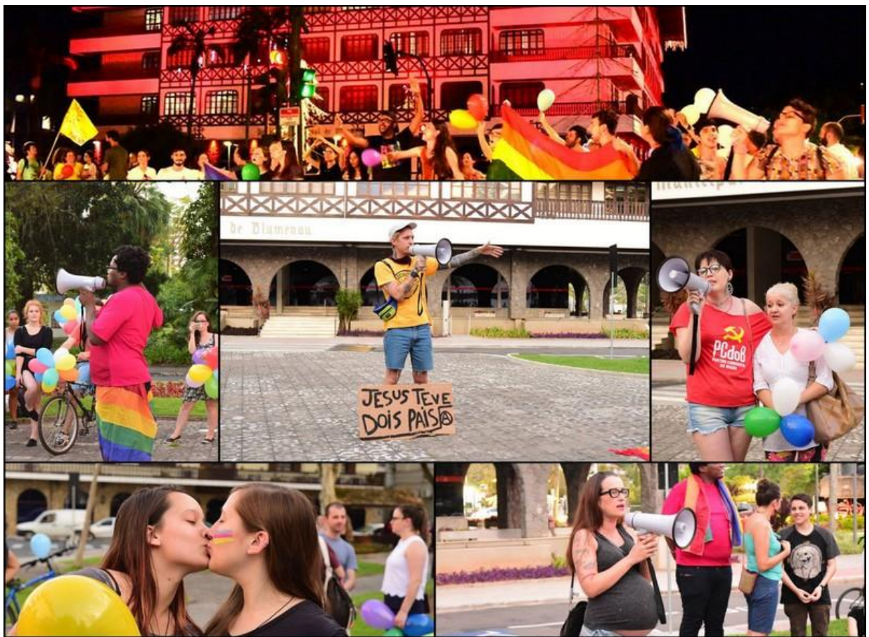
Figura 3 - Fotos do ato: SOMOS FAMÍLIA promovido pelo coletivo LGBT Liberdade no dia oito de dezembro de 2017