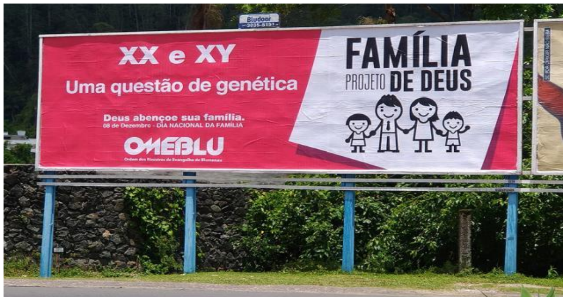
Figura 1 - Outdoor em Blumenau destaca família como homem e mulher, 2017

Em 2017, na ocasião do dia da família, a OMEBLU, Ordem dos Ministros do Evangelho de Blumenau, dispôs de organização e articulação prévia, a considerar os outdoors dispostos e pagos em pontos estratégicos da cidade com aproximadamente um mês de antecedência ao feito de distribuir balões. Contou também com significativas contribuições a considerar os custos e manutenções de outdoors que ainda estão sendo mantidos em alguns lugares da cidade (Figura 1).