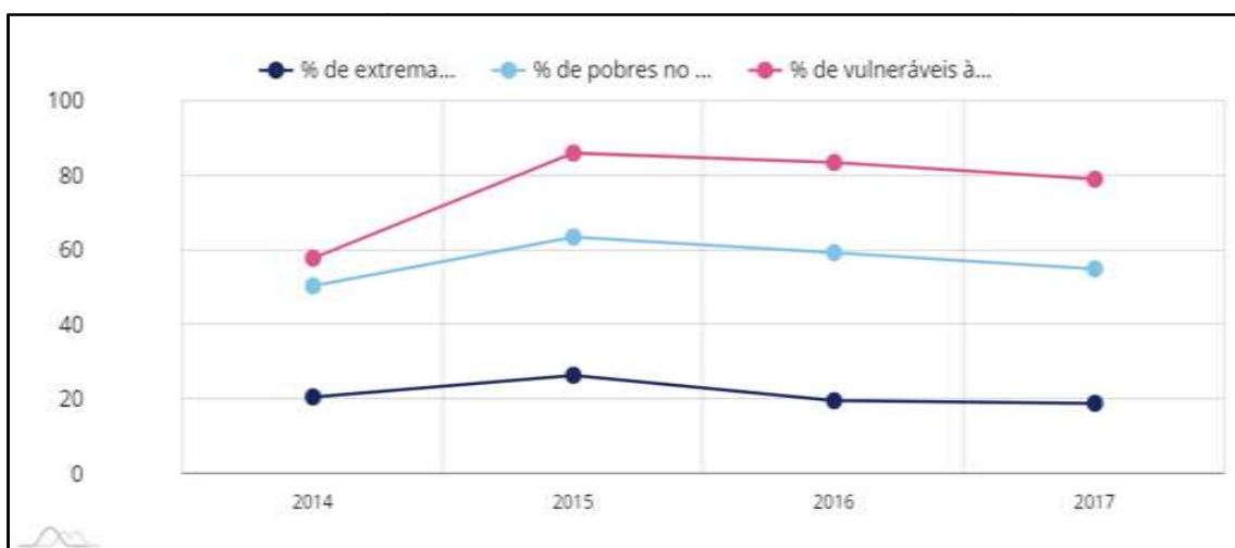
Gráfico 1 - Evolução das proporções de extremamente pobres, pobres e vulneráveis a pobreza inscritos no CadÚnico após o Programa Bolsa Família no município de Congonhinhas - PR entre os anos de 2014 a 2017.

com 63,6% e 26,52% respectivamente. No ano de 2016 as proporções se mantiveram semelhantes à de 2015. Apenas em 2017 que a porcentagem de vulneráveis, pobres e extremamente pobres voltaram a diminuir.