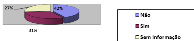
Gráfico I - Fichas de Atendimento Social por tipo de dado.

Em outras 275 Fichas, à pergunta sobre o “delito na adolescência” foi dada resposta negativa. Esse grupo de respostas representa um percentual de 42% do total. Já, em outras 202 Fichas de Atendimento Social, a resposta sobre o “delito na adolescência” foi afirmativa, representando 31% do total, conforme mostra o gráfico a seguir: