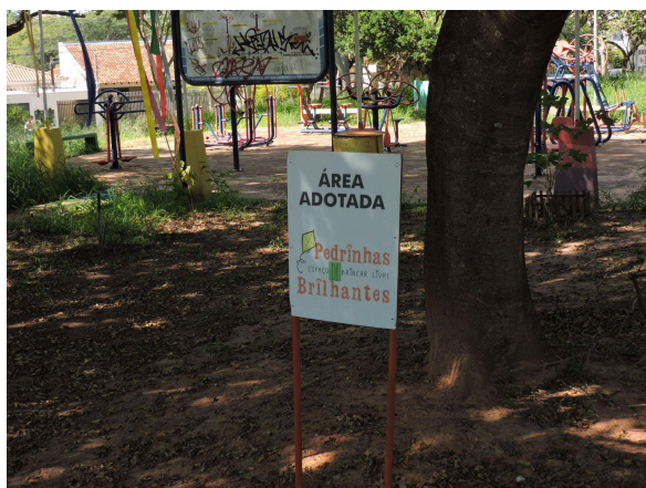
Figura 1: Área adotada na Praça dos Imigrantes, Presidente Prudente - SP

As figuras a seguir exemplificam duas áreas de praças adotadas no município de Presidente Prudente - SP.