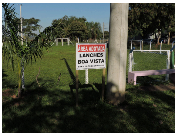
Figura 2: Área adotada na Praça Virgínia Feitosa Moura, Presidente Prudente - SP