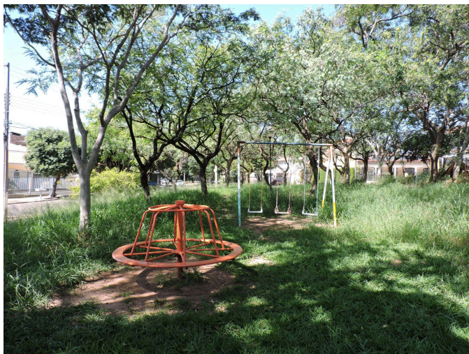
Figura 3: Área com parquinho na Praça dos Imigrantes, Presidente Prudente/SP

Tendo isso em vista, o mapa 2 apresenta as praças prudentinas com maior disponibilidade de contato com a natureza. Nesse aspecto, foi considerado a presença de alguns elementos naturais, como árvores, arbustos, flores, areia e grama, bem como o sombreamento proporcionado pela vegetação sob as áreas de maior probabilidade de interação social, como as áreas de parquinho, bancos e mesas. Entretanto, é importante mencionar que a presença de natureza se mostra como um aspecto positivo à medida que o poder público garante a manutenção ambiental desses espaços. Caso contrário, o estado de conservação das praças pode representar um risco aos seus usuários, especialmente às crianças. A figura 3 a seguir exemplifica uma praça em que, apesar de as características ambientais serem, de modo geral, positivas, a ausência de manutenção paisagística compromete a percepção social do espaço enquanto um lugar de sociabilidade e lazer.