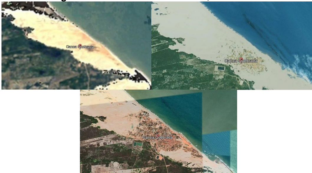
Figura 2: Canoa Quebrada em 1985, 2004 e 2024

Contextualizando as mudanças que ocorreram durante a História de Canoa Quebrada, houve a necessidade de revelar as mudanças estruturais ocorridas na paisagem da cidade. Sendo assim, primeiramente, foi utilizado o software Google Earth Pro, que produz imagens aéreas históricas, que auxiliarão em uma análise paisagística das alterações urbanas ocorrida no espaço.