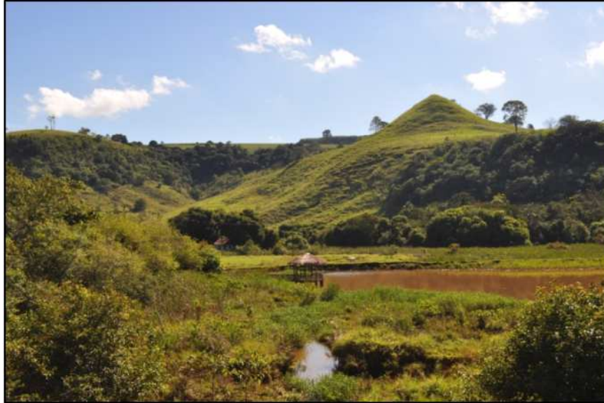
Figura 3 – Ponto 1: Cabeceira de drenagem em anfiteatro e morro testemunho