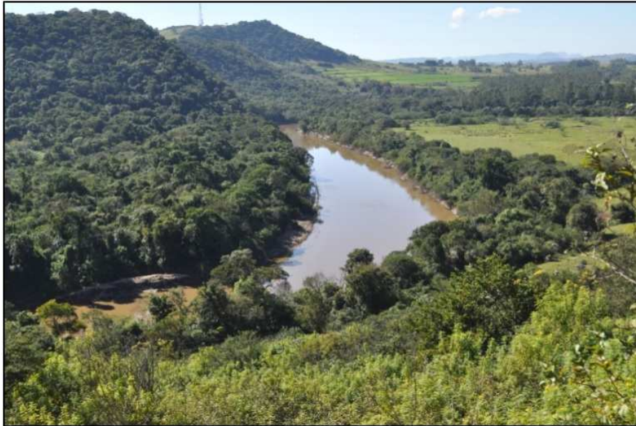
Figura 6 – Anomalia de rede de drenagem no Rio das Cinzas