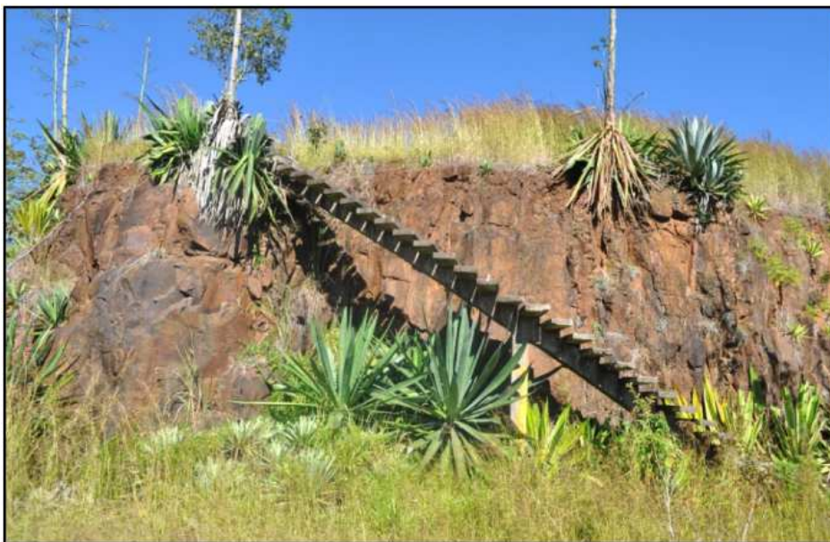
Figura 5 – Afloramento de basalto com alto teor de ferro – Margens PR-439