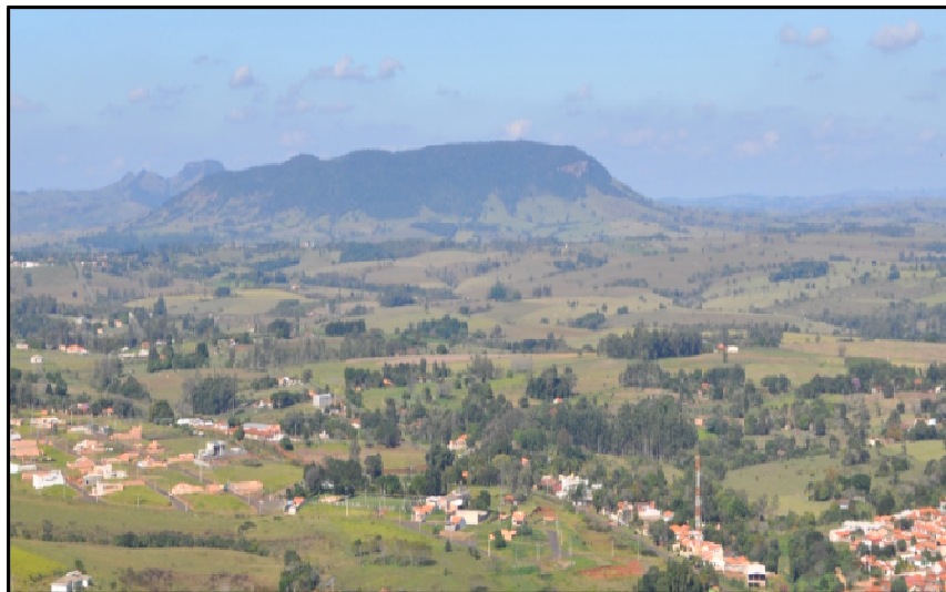
Figura 13 – Ponto 6: Relevo de Cuesta