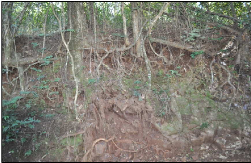
Figura 11 – Ponto 5: Intemperismo em rocha basáltica em corte de estrada