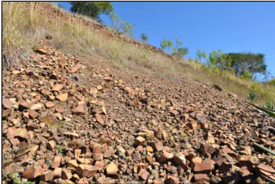
Figura 4 – Ponto 2: Afloramento de basalto intemperizado com alto teor de ferro –Margens da rodovia PR - 439