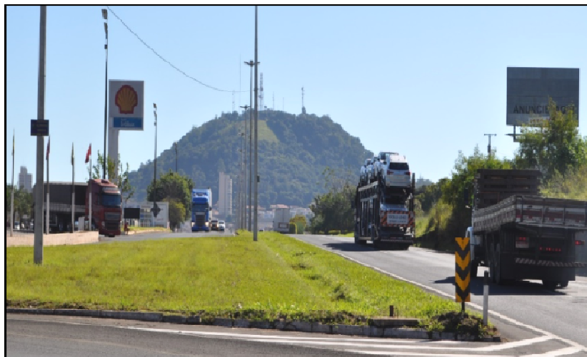
Figura 10 –: Morro testemunho