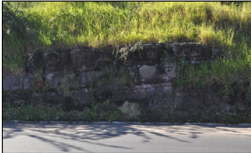
Figura 9 – Afloramento da Formação Botucatu em Corte de Estrada