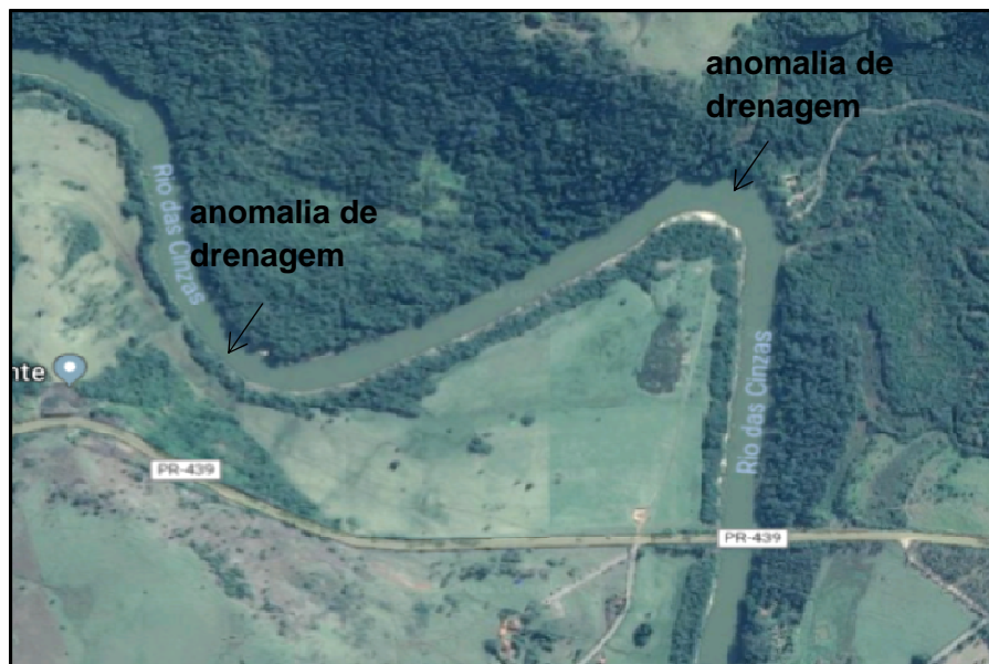
Figura 7 – Trecho do Rio das Cinzas

Conforme Firmino (2015, p. 61), “Anomalias de drenagem são comportamentos de canais fluviais que fogem do padrão observado na natureza”. No caso deste trecho da bacia do Rio das Cinzas, foram originadas pelo controle estrutural existente na região, principalmente, pelas falhas na estrutura rochosa.