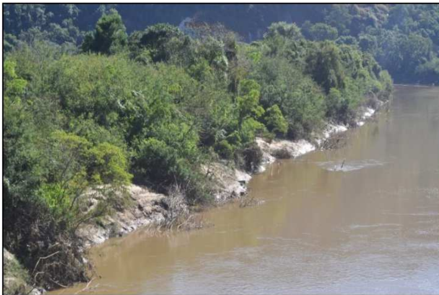
Figura 8 – Mata ciliar e depósitos fluviais de margem – Rio das Cinzas