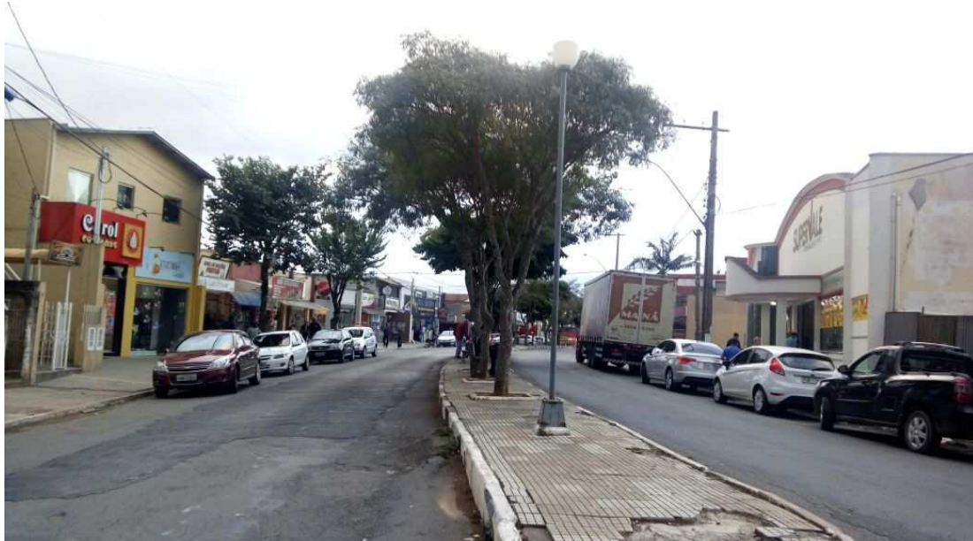
Figura 7: Avenida Eduardo Luciano Marras em 2018.