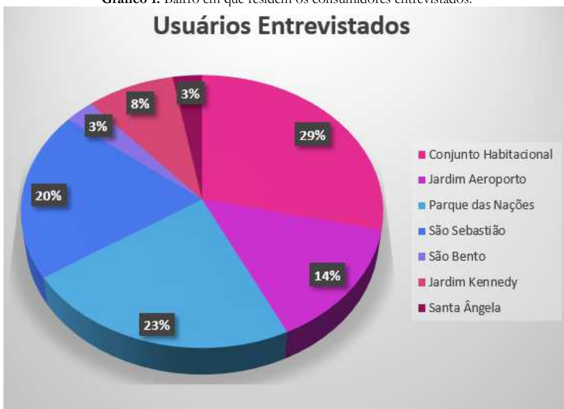
Gráfico 1. Bairro em que residem os consumidores entrevistados.