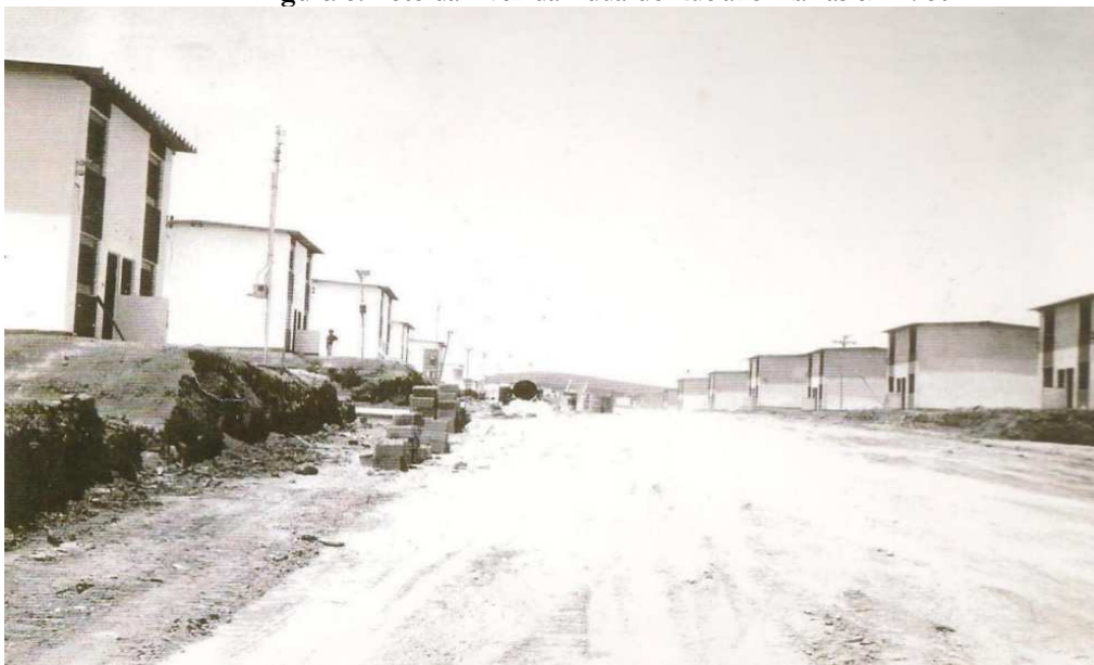
Figura 6: Foto da Avenida Eduardo Luciano Marras em 1980.