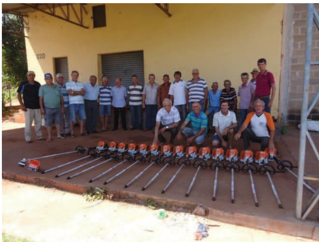
Foto 2. Equipamentos adquiridos através do Microbacias II

Neste novo plano de negócio consiste na aquisição de mais uma colheitadeira e também uma podadeira tratorizada, como são mostradas nas fotos 2, 3 e 4.