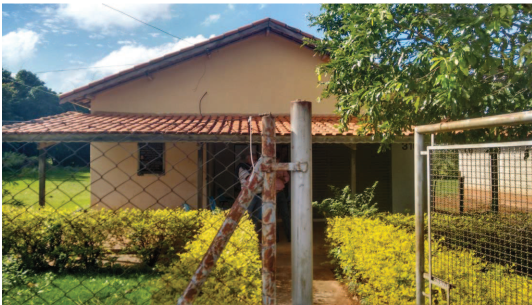
Foto 1. Associação dos Produtores Rurais Industriais e Moradores de São João Do Pau D'Alho (APRIMOR)