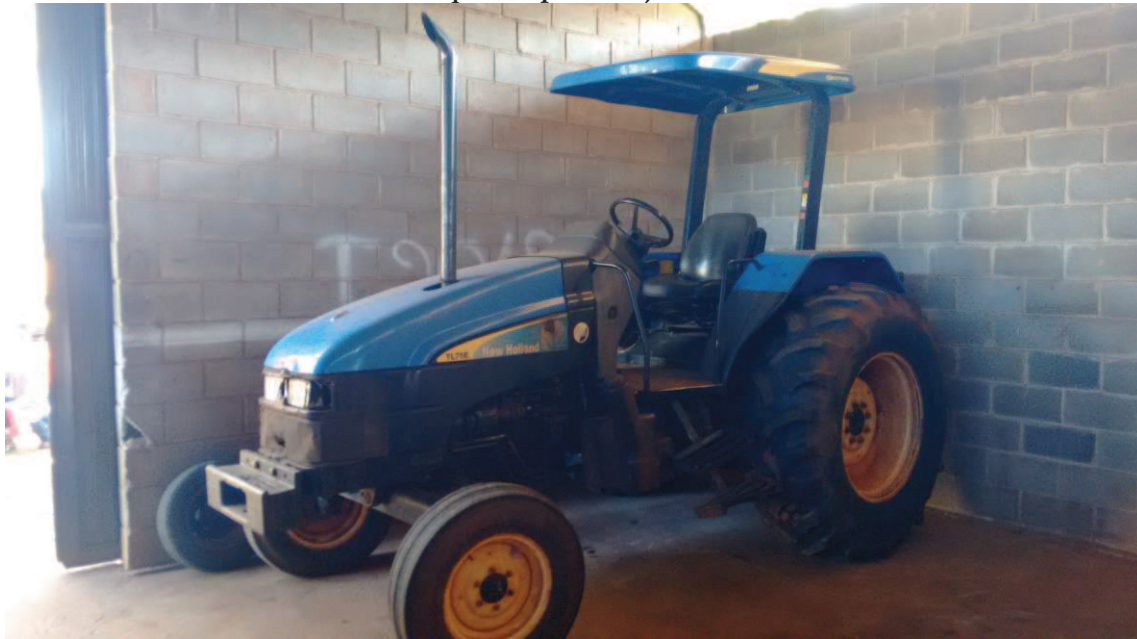
Foto 4. Trator adquirido pelo Projeto de Microbacias II