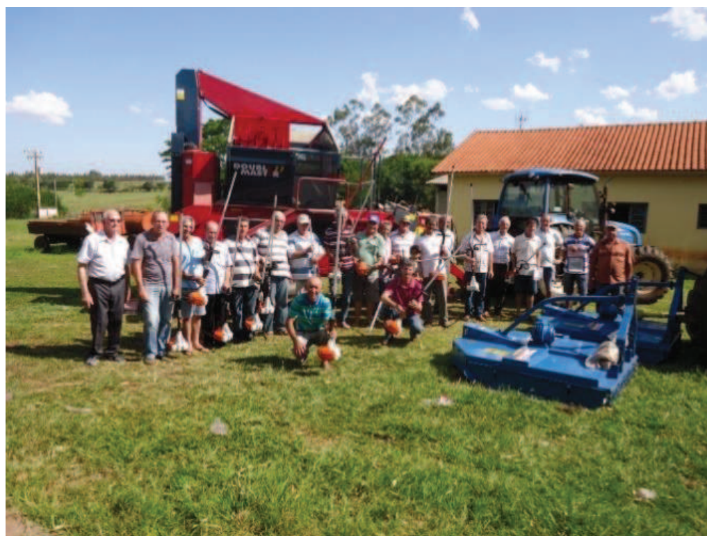
Foto 3. Equipamentos adquiridos através do Microbacias II