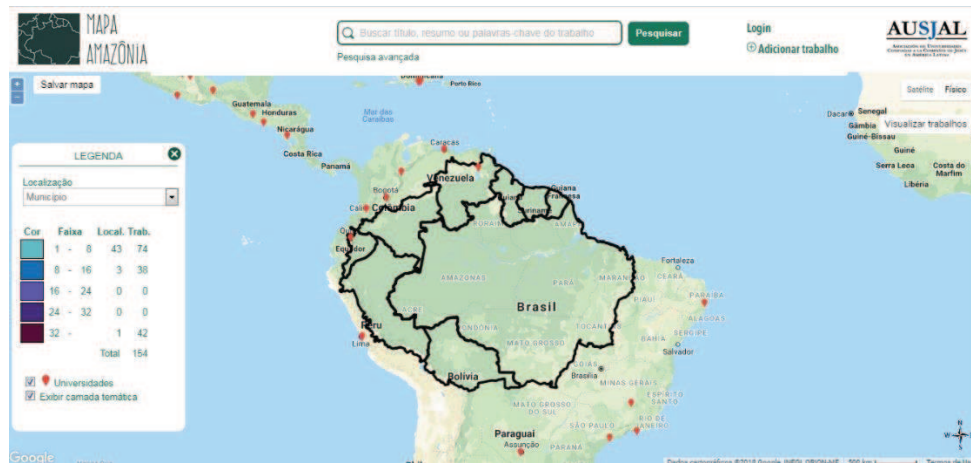
Figura 6 – Versão do mapa na opção físico e não de satélite