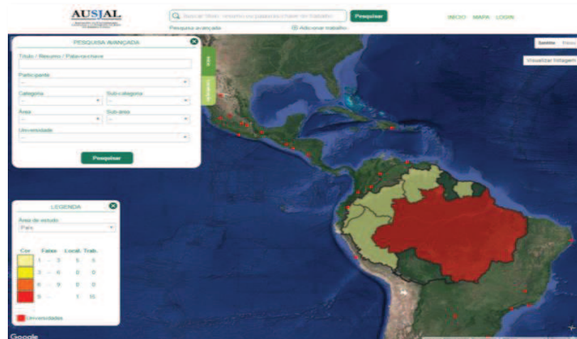
Figura 3 – Ferramenta de busca com visualização interativa em escala territorial