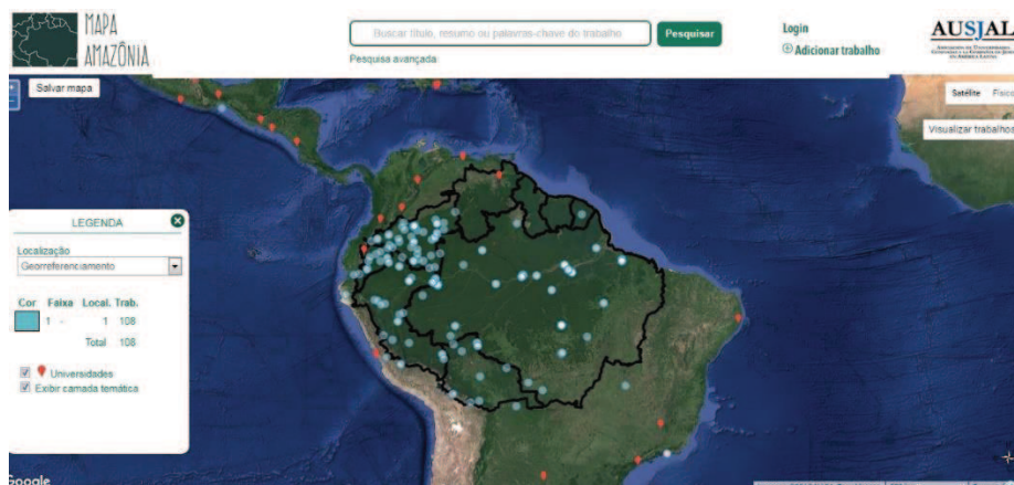
Figura 5 – Busca por georreferenciamento mostra os pontos dos trabalhos