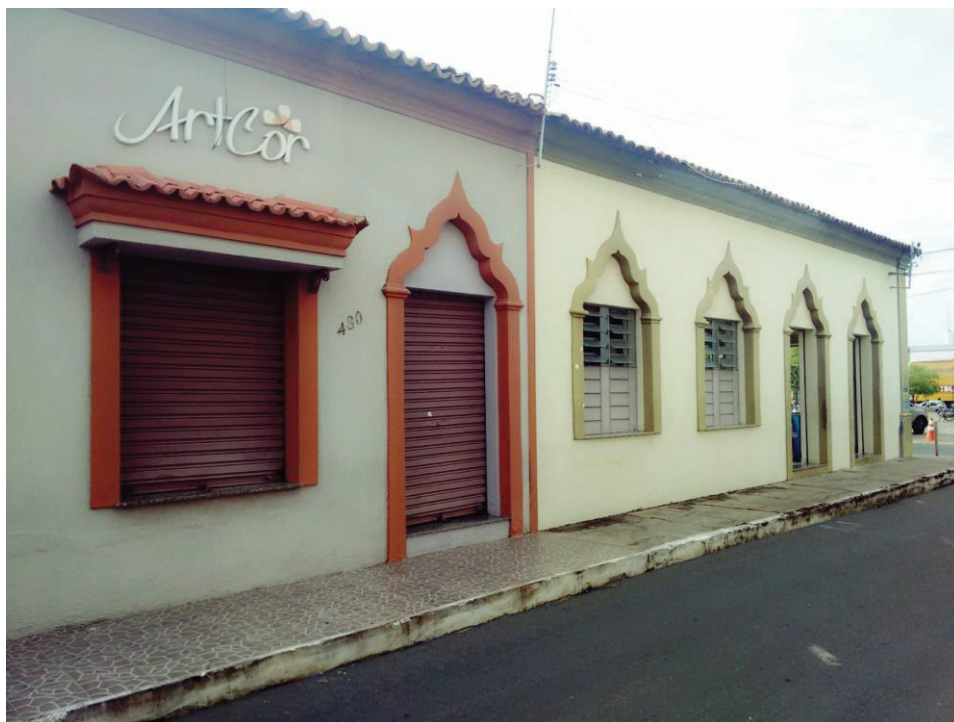
Figura 2 : Fachada de construções árabes no centro da cidade de Floriano - PI

Hoje, estes estabelecimentos vêm exercendo diferentes funções, mas fica evidente a predominância e influência da arquitetura árabe na estrutura urbanística desta cidade como pode ser observado na figura 2 a seguir.