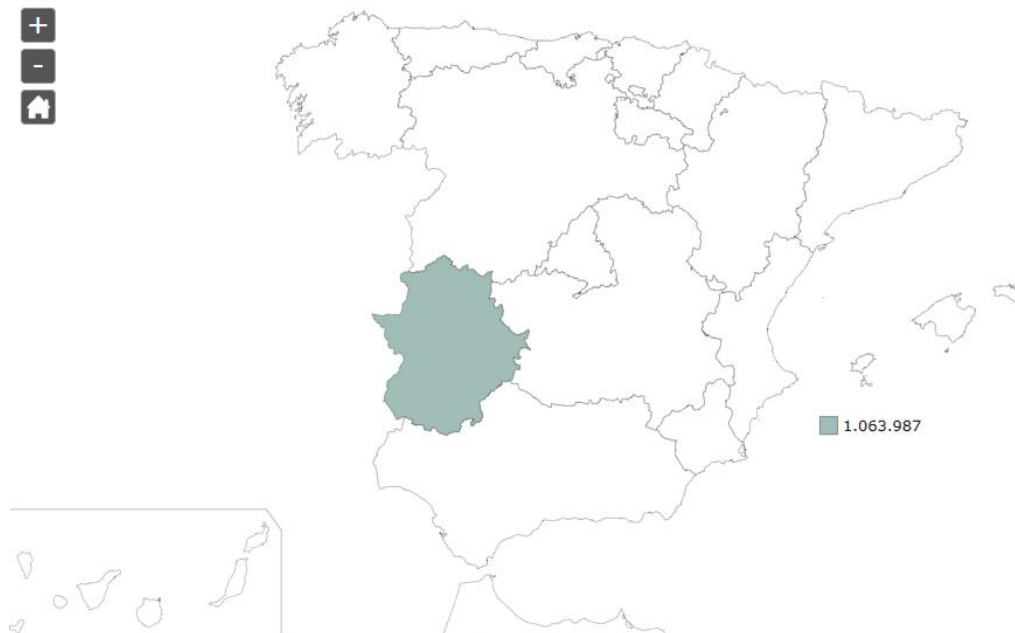
Imagen 1. Mapa de situación de la región extremeña

Extremadura es un destino español fronterizo con Portugal (Imagen 1) y caracterizado por unos recursos naturales y culturales de gran valor (Hernández Mogollón, 2008). Está formado por dos provincias: Cáceres y Badajoz. Según el Instituto Nacional de Estadística (INE), su población se reduce una media de -0,55% en los últimos 5 años (2016-2020), contando en 2020 con una población de 1.063.987 personas en toda la comunidad autónoma y una densidad de población de aproximadamente 25 habitantes por kilómetro cuadrado (km 2 ) (Instituto Nacional de Estadística, 2021). La Ley de Desarrollo Sostenible del Medio Rural (LDSMR) señala el límite de la ruralidad en una densidad de menos de 100 habitantes por km 2 . Es por ello que Extremadura se considera un entorno rural en este estudio.